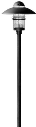
Dekorative Leuchte Gaustraße