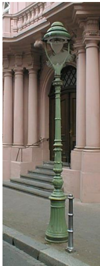
Gaslaterne Dalberger Hof