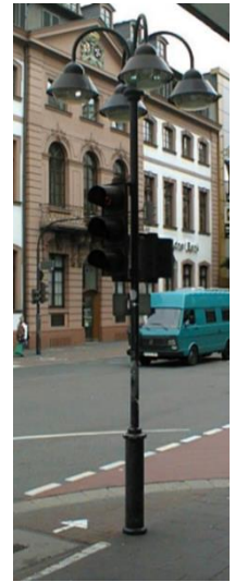
Dekorative Leuchte mit Ziermast