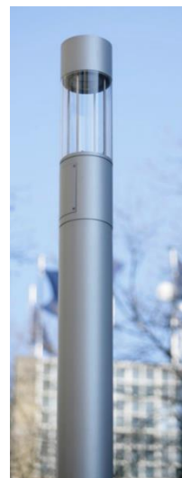
Lichtstele Schillerplatz/ Bahnhofstraße