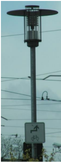
Dekorative Leuchte Bleichenviertel